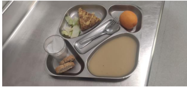
4 - DIMARTS