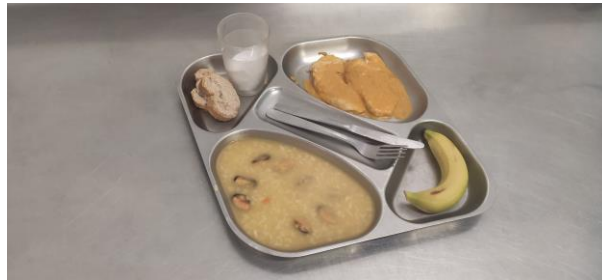
5 - DIMECRES