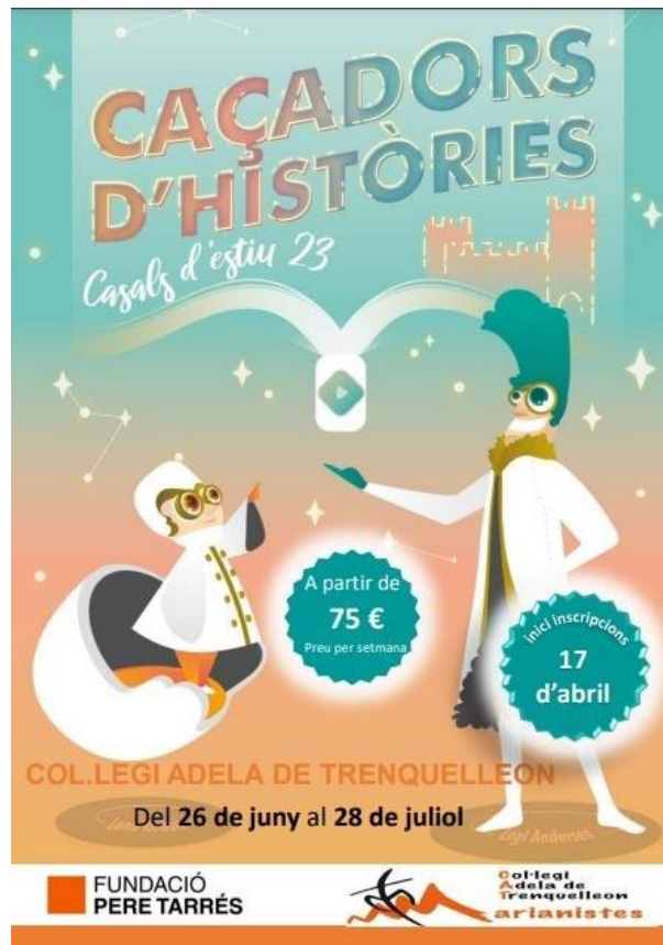
1 - Casal d'estiu 2023 2