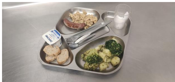
6 - DIJOURS